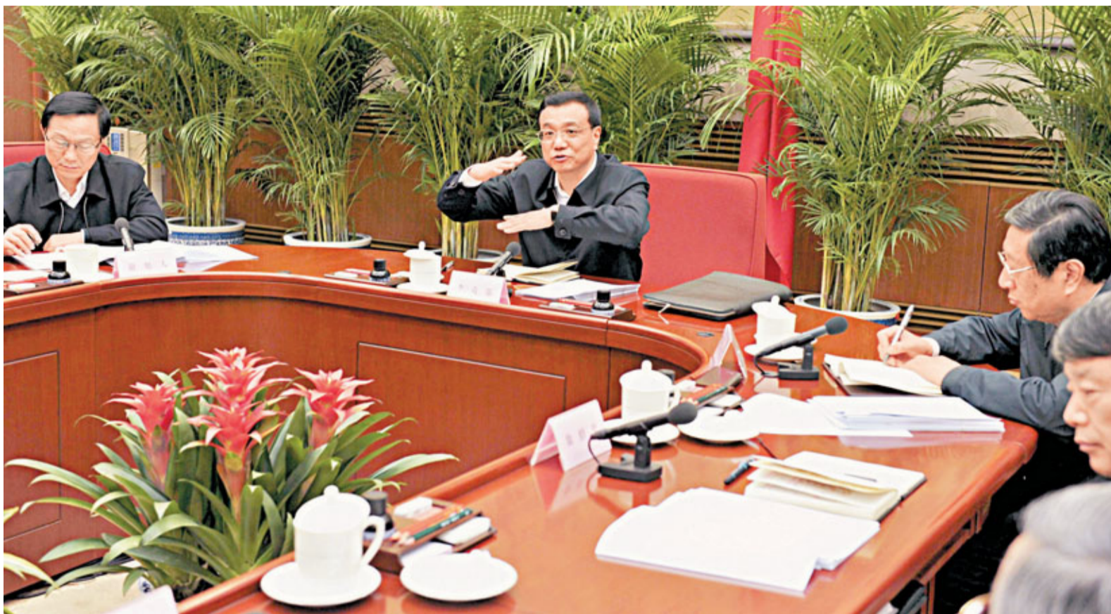
李克強指出，經濟的增長應當與收入增長同步，如果GDP無法讓民眾增加收入，增速再高也是「自拉自唱」。

香港文匯報訊 據中新社報道，國務院副總理李克強表示，經濟的增長應當與收入增長同步，如果國內生產總值(GDP)無法讓民眾增加收入，增速再高也是「自拉自唱」。同時，李克強強調，發展要重在提高品質效益，用改革紅利釋放內需潛力。