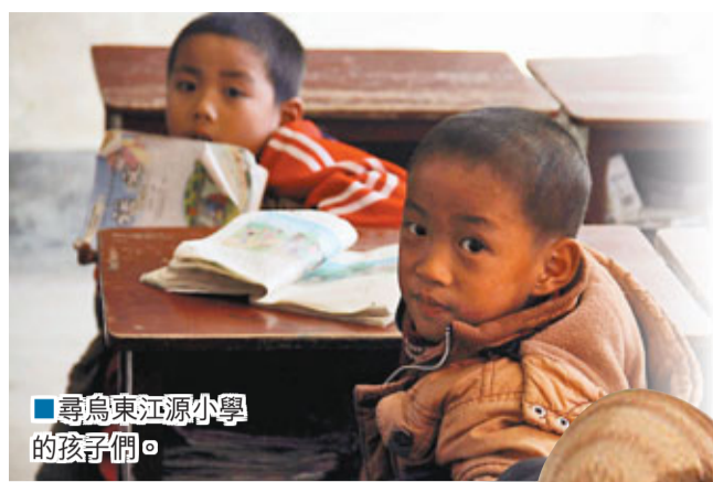
尋烏東江源小學的孩子們。