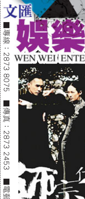
■柏林影展版電影海報。■《一代宗師》由梁朝偉、章子怡、張震等人主演。