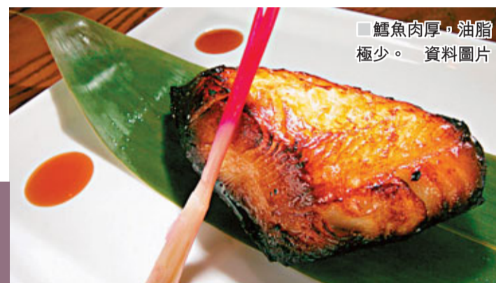
鱈魚肉厚，油脂極少。資料圖片

由此可見，鱈魚在西方歷史的重要性。但在千萬種魚類中，又豈止鱈魚一種？還有許多不同的魚類對歐洲發展同樣帶來重要影響，如三文魚等。