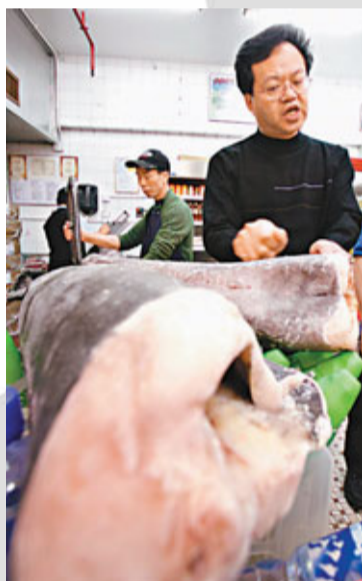
隨着人類的需求增加，近年鱈魚的產量銳減。資料圖片

其實，鱈魚瀕危問題一直存在。戰後的國際貿易頻繁，最大特點是小國參與其中。在北海地區中，冰島便善用其天然漁獲而發展漁業貿易，鱈魚便是主要海產。結果，他們大量捕魚，以致漁獲銳減。1954年，鱈魚產量開始減少。當時，除冰島外，挪威也是漁業貿易的領導者。但是，各國大量捕魚，漁獲危機惡化。到1974年，根本找不到12歲以上的鱈魚，情況如同今天，因此各國開始協商禁捕期以保護鱈魚。其後，到上世紀80年代至90年代，分別出現鱈魚瀕危的情況。