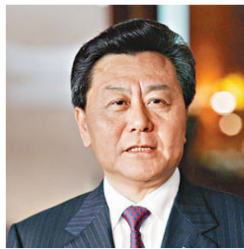
■國務院任命李剛為中央人民政府駐澳門特別行政區聯絡辦公室副主任。

香港文匯報訊（記者 聶曉輝）聖誕假期臨近，香港各口岸將擠滿出入境的人潮。入境處預計，聖誕節及元旦假期期間，共有865萬人次循海、陸、空各個管制站進出香港，較去年同期增加約11%，其中約75%旅客會經陸路進出；出境及入境的高峰期料為本月22日及26日。入境處鐵路科（邊境管制）指揮官黃然生指出，為免有水貨客及雙非孕婦藉出入境繁忙時間「混水摸魚」入境，該處將加派便衣人員巡查，嚴防他們伺機「闖關」。