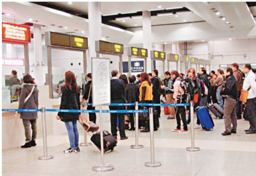
■入境處預計，聖誕節及元旦假期期間，共有865萬人次進出香港。

為避免口岸過擠塞及旅客輪候時間過長，入境處呼籲旅客應預早計劃行程並盡量避免選擇在一些繁忙時段過關；香港居民出門前亦應檢查回鄉卡的有效日期。入境處已在各管制站裝設了400條e道，若香港居民在外旅遊時需要協助，可致電入境處24小時求助熱線1868。