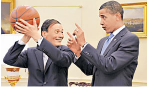
王岐山率團赴美出席第23屆美中商貿聯委會，並與奧巴馬總統等政要會面。圖為2009年7月28日王岐山訪美時，奧巴馬向王岐山贈送籃球。 資料圖片

柯克也表示，「商貿聯委會對於解決對美國利益相關方具有重要意義的貿易和投資問題，並將我們與中