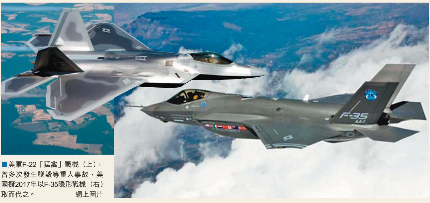
美軍F-22「猛禽」戰機(上)，曾多次發生墜毀等重大事故，美國擬2017年以F-35隱形戰機(右)取而代之。

專家指出，日本政治近年不斷「向右轉」，甚至可能在「再軍事化」的道路上越走越遠，而這勢將惡化中日關係，而美國實際上也是故意製造中日間的緊張關係，從而為自身漁利，但這卻並不利於亞太地區的發展與安全。