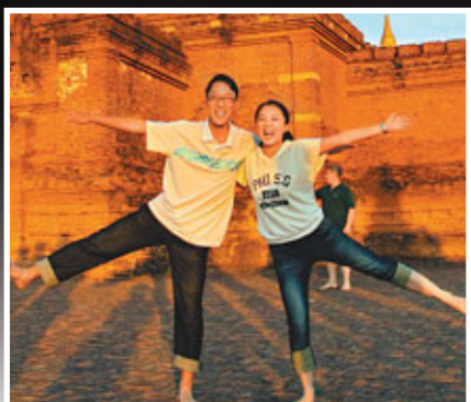
譚小姐表示，「我們會靜靜呆在一起，共同期待來生還在一起！」