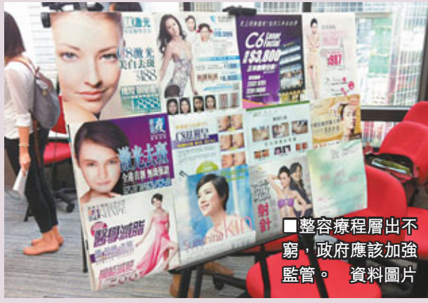
■整容療程層出不窮，政府應該加強監管。 資料圖片

審美價值觀 (Aesthetic Value) 意指大眾對美的看法、態度及認知，即人們眼中的「美」是甚麼。從古到今，「女為悅己者容」的觀念主宰女性對追求美麗的心理狀態。但不同社會對女性的審美標準都隨時代、地域而發生變化。自中國楚代的纖腰、唐代的豐滿圓潤、上世紀50年代至70年代的腰細臀大，直至90年代後期受到父權社會和傳媒影響，認為女性越瘦削越好。於是，商人開始排山倒海地利用廣告宣傳，配合消費文化的盛行，營造「瘦」等於「美」等於「幸福快樂」的觀念，吸引人們購買纖體產品，賺取利益。在潛移默化下，人們特別是處於青春期的少女逐漸認為「肥是羞恥的、醜陋的、悲慘的」，而接受「瘦就是美」的觀念。這種觀念逐步深入民心，在社會上盛行，令很多人開始盲目追求瘦削身形，以得到大家的認同、對自己的體形建立自信，形成一種「纖體文化」。