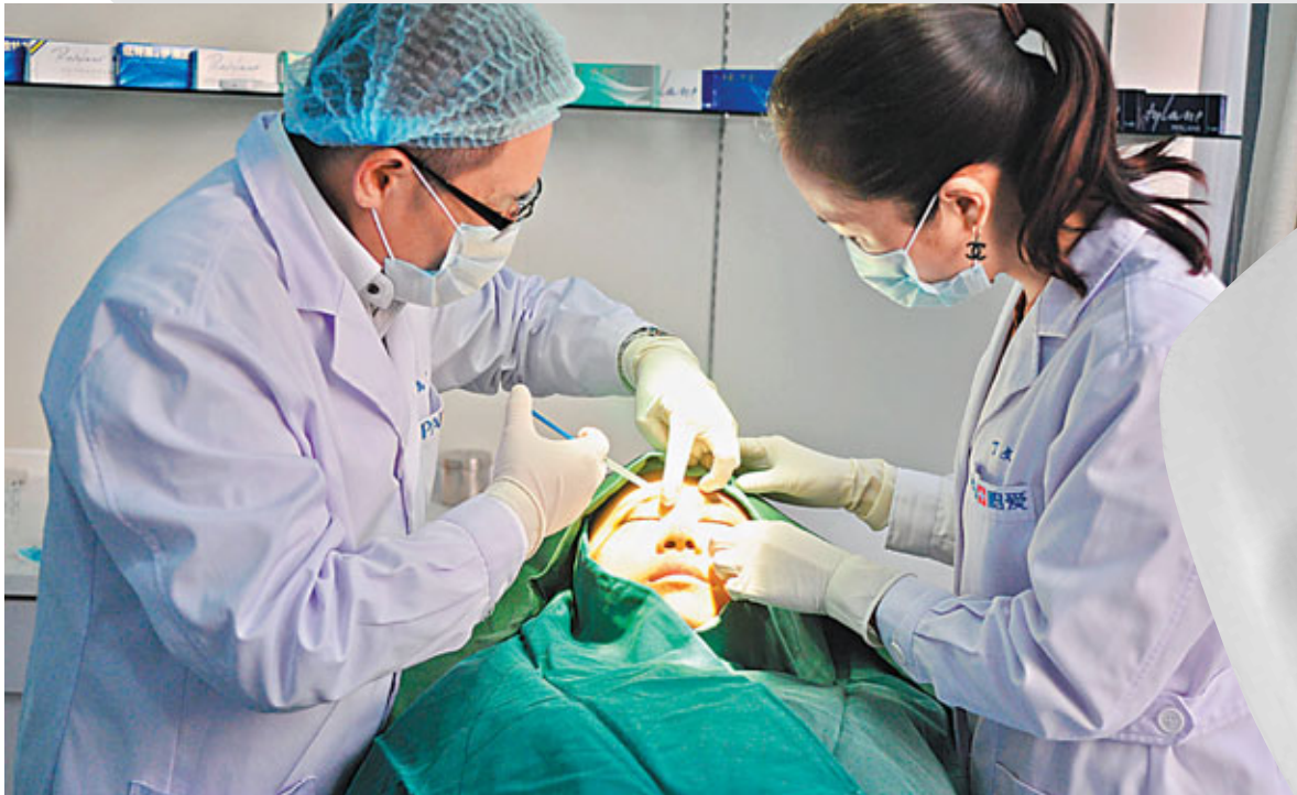
■整容手術涉及眾多風險。 資料圖片

「每個女性都有追求自我完美的權利和義務。」這句廣告文字如今已成為香港眾多女性的座右銘，在媒體和明星效應的影響下，越來越多女性不惜一切代價來進行美容、整容、矯形等手術，目的為瘦身（抽脂）、隆胸、瘦腿、墊高鼻梁、削尖下巴，甚至通過手術來改變眼睛大小（割雙眼皮）、臉部輪廓（瘦臉）和骨骼形狀大小，以及打美容針來消除皺紋和美白等。此類美容療程和產品隨着人們追求美和時尚，變得非常受到追捧，很多人不惜昂貴代價甚至生命危險來購買和嘗試這些產品。雖然近年來因美容導致的醫療事故層出不窮，人們對這類產品的熱情似乎並無減輕，今年10月香港的DR醫學美容集團透過吊鹽水方式將可用於抗癌的免疫細胞輸入女性顧客體內，結果導致細菌入血引起敗血性休克的死亡慘劇，引發社會各界的震驚和遺憾。事件不僅反映社會大眾對「美」的認知產生偏差，更顯示政府和社會缺乏措施來監管這些機構，相應政策和法律的制定已刻不容緩。