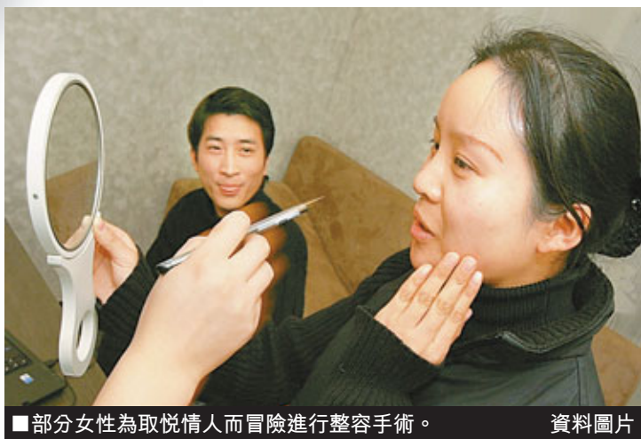
■部分女性為取悅情人而冒險進行整容手術。 資料圖片

追求美麗是人的本能和天性，所謂「愛美之心人皆有之」，但愛美人士更應學會調整自己的心態，接納不完美的自己；同時，切勿將自己與廣告電影中的模特相比，妄自菲薄追求那些不現實的臉蛋和身材。針對當前眾多為牟利而營運的醫療美容機構，當局也應採取管轄措施，避免更多毀容甚至死亡悲劇的發生。