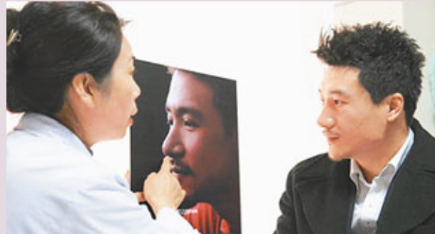
■整容不是女性的專利，連男性也為之瘋狂。