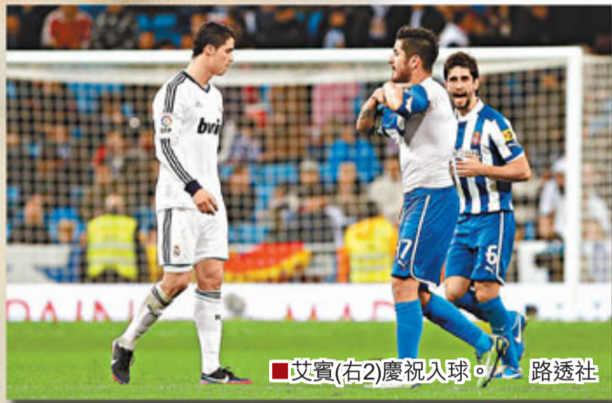
■艾賓(右2)慶祝入球。

西甲冠軍之爭在「世界末日」到來前，似乎便已早早地失去了懸念。香港時間16日凌晨，皇家馬德里在主場2：2被愛斯賓奴逼和的同時，巴塞羅那則繼續高歌猛進，4：1橫掃馬體會。排第3的皇馬落後榜首的巴塞達13分之多，基本退出了冠軍爭奪；主帥摩連奴賽後「繳械」，他說：「贏得聯賽已幾乎不可能。」