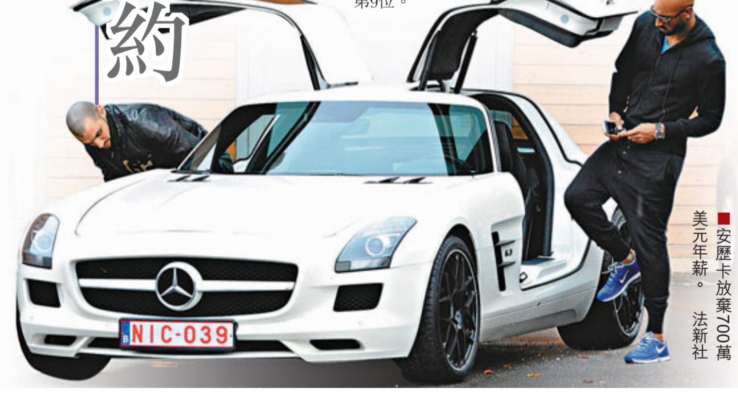
■安歷卡放棄700萬美元年薪。