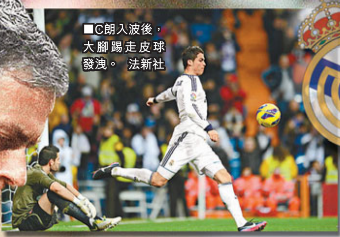
■C朗入波後，大腳踢走皮球發洩。