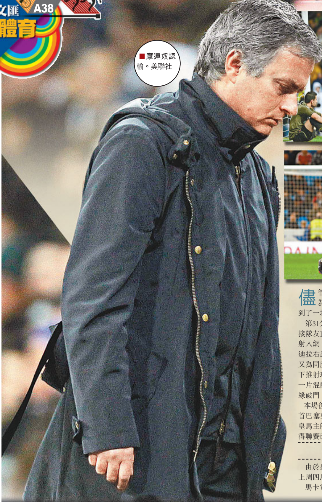
■摩連奴認輸。