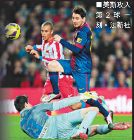
■美斯攻入第2球一刻。