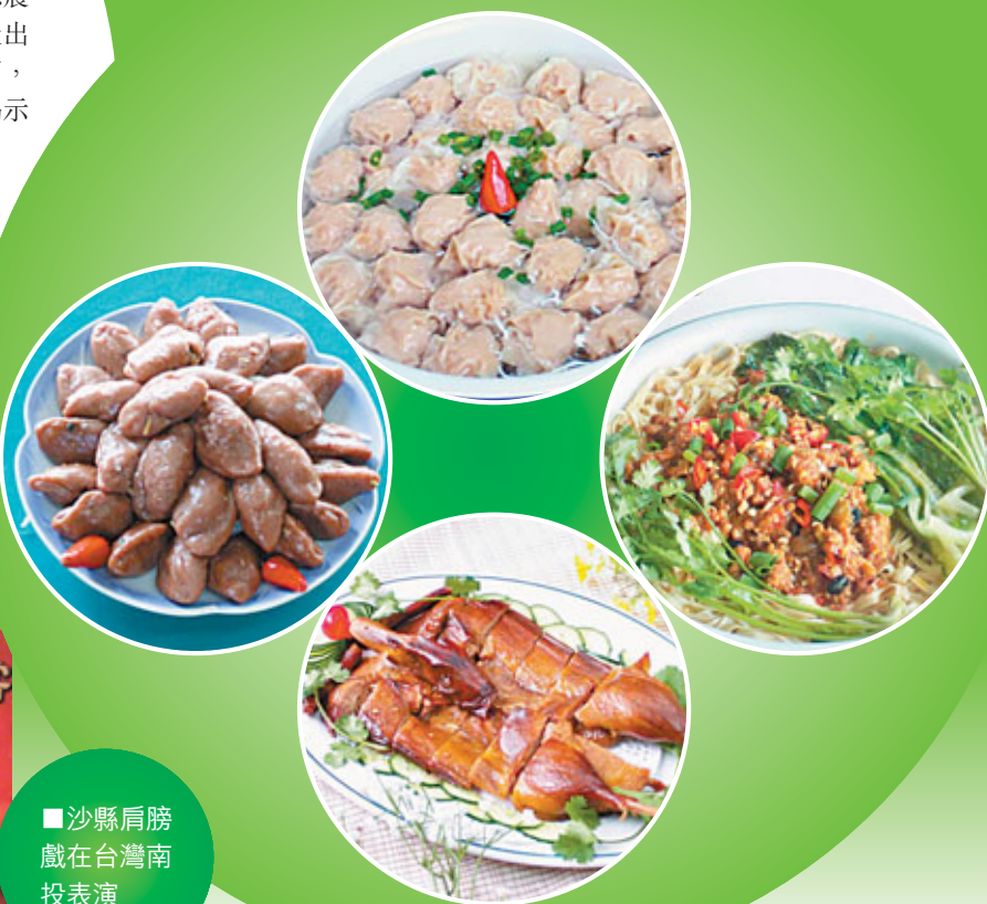
■沙縣肩膀戲在台灣南投表演

沙縣位於福建省中部偏西北，閩江支流沙溪下游，肇始於東晉義熙元年（公元405年），迄今已有一千六百餘年的歷史，自古即為閩西北重要商品集散地，素有「金沙縣」之美譽。然而眾所周知，沙縣今天的名滿天下，幾乎全部功勞應歸於「沙縣小吃」——這一枝獨秀的小吃文化。