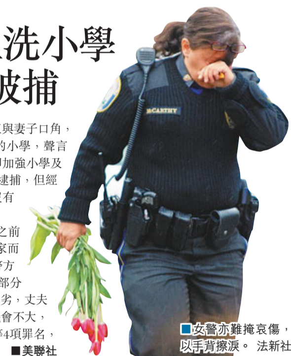
■女警亦難掩哀傷，以手背擦淚。

據報這宗案件是在康州校園槍擊案之前發生，疑犯遇鄰當天恐嚇妻子後，離家而去，妻子隨即報案，不敢回校工作。警方在遇鄰住所搜出47支槍及彈藥，但大部分屬古董收藏，其妻亦承認夫婦關係惡劣，丈夫常出言恐嚇，因此警方相信遇鄰作案機會不大，不過仍控告他刑事恐嚇、拒捕及家暴等4項罪名，還押候審。