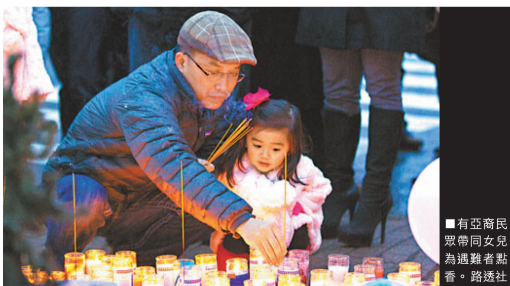
■有亞裔民眾帶同女兒為遇難者點香。