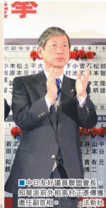
中日友好議員聯盟會長、知華派前外相高村正彥獲邀任副首相。