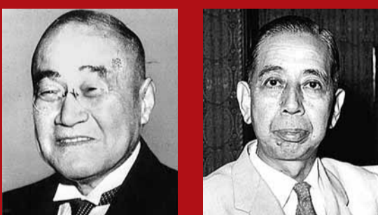
麻生太郎外祖父 吉田茂 安倍晉三外祖父 岸信介

安倍晉三出身政治世家，父親安倍晉太郎曾任外相，外祖父是前首相岸信介，岸信介之弟是前首相佐藤榮作，岸信、佐藤的姨母是前首相吉田茂(前首相麻生太郎的外祖父)之母，因此安倍與麻生份屬遠親，反映日本政治家族錯綜複雜的關係。