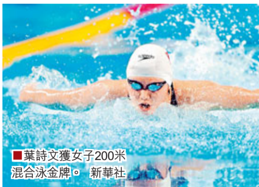
葉詩文獲女子200米混合泳金牌。新華社

當天進行的另外四項決賽中,陶宛選手梅魯提特和巴西選手桑托斯分別以1分03秒52和22秒22的成績打破女子100米蛙泳和男子50米蝶泳的賽會紀錄,並摘金。其他兩枚金牌分別被澳大利亞和美國選手獲得。 ■新華社