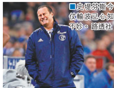
史堤芬斯今仗輸波已心知不妙。

德甲歇冬前最後一戰，史浩克04主場被弗賴堡反勝3:1，近6輪2和4負跌至第7位，去年9月重返史浩克第2度執教該隊的主帥史堤芬斯，昨日遭到解職，球隊會由青年軍教練贊斯基拿暫掌兵符。今仗為客隊梅開二度的真羅辛度完場前9分鐘被逐，主隊前鋒亨特拉爾之後亦領紅牌離場。