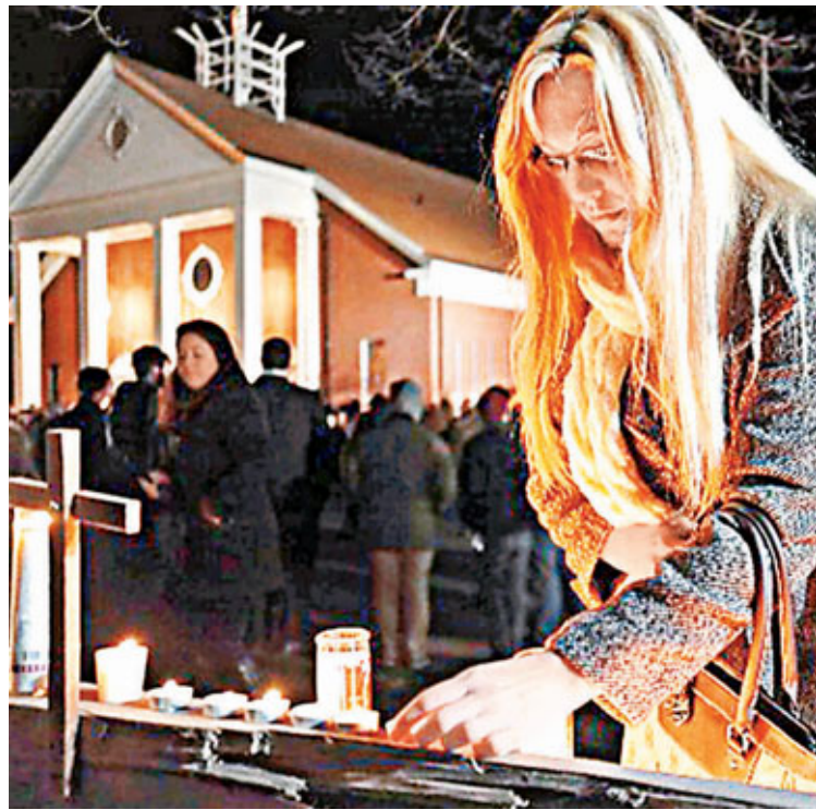
■民眾點蠟燭悼念槍擊案受害者。