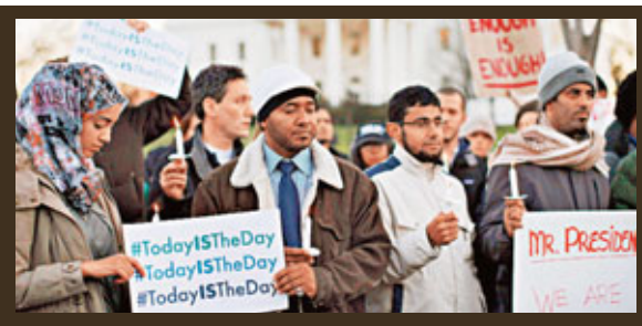
■多人在白宮外集會。