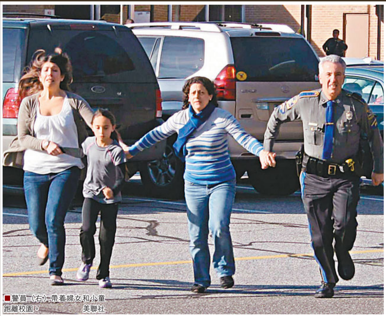
■警員(右)帶着婦女和兒童跑離校園。

行兇武器： 現場發現至少3支槍械 槍手身旁： 德國Sig Sauer P226半自動手槍 ■9毫米口徑 ■可裝15發子彈 奧地利Glock半自動手槍 ■9毫米口徑 ■可裝17發子彈 槍手車內： 大毒蛇(Bushmaster) 點223口徑雷明登突擊步槍/可裝30發以上子彈