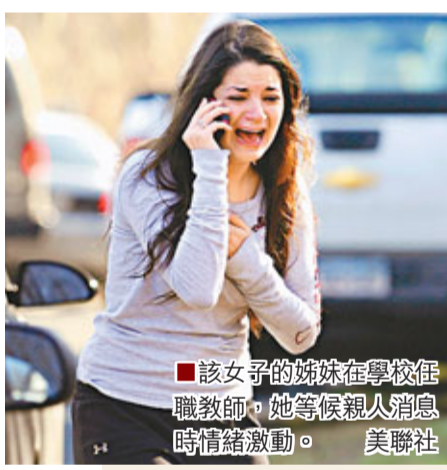
■該女子的姊妹在學校任職教師，她等候親人消息時情緒激動。

再大的劫難，也擋不住人性的光輝！今次槍擊案共造成8名成人喪生，除兇徒蘭扎及其母親南希外，另外6人被指均是桑迪胡克小學的教職員。27歲女老師索托以身作盾為學生擋子彈，成為槍下亡魂；47歲校長霍赫施布隆及56歲心理輔導醫生舍拉克則在事發時跑出走廊抵抗槍手蘭扎，結果被行刑式手法槍殺。他們捨身保護學生和同僚，英勇事蹟感動世人。