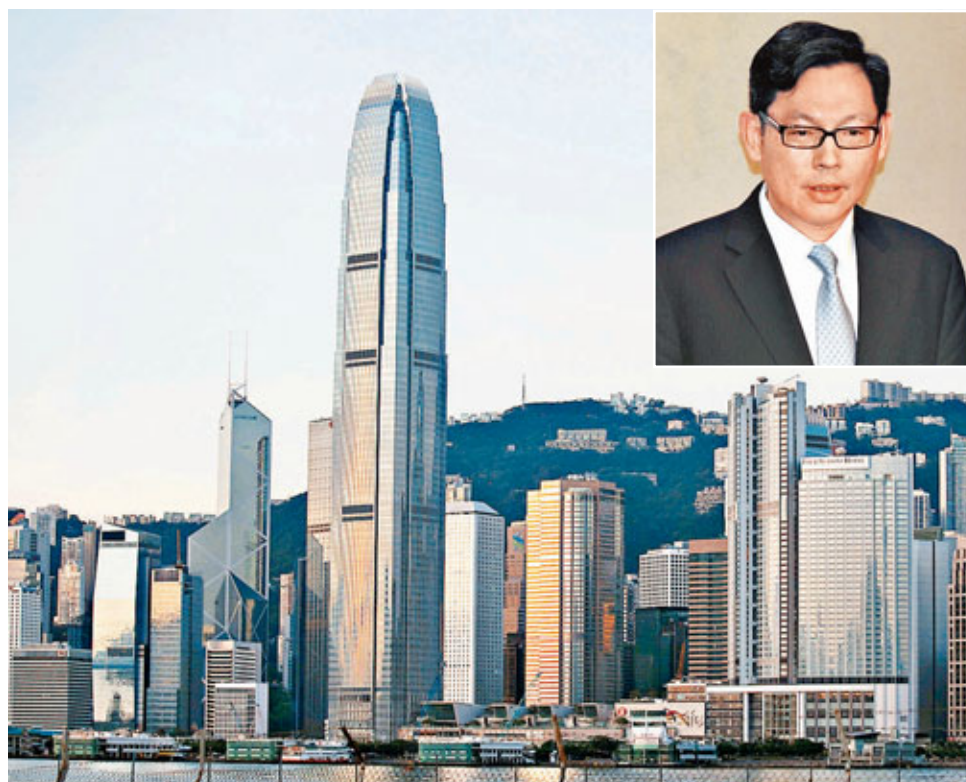
陳德霖(小圖)承認，熱錢對本港資產價格構成一定壓力。

香港文匯報訊 外電引述恒生銀行發布研究報告指出，雖然金飾消費需求下降或拖累金價，但世界各大央行寬鬆的貨幣政策，以及官方機構增購黃金將抵銷需求下滑的影響，2013年金價將延續升勢。金價雖然存有下跌風險，但面對環球金融危機，黃金依舊是少數每年回報達雙位數的資產。該行分析指出，環球經濟疲弱亦可能減低市場對黃金的需求，導致金價下跌。世界黃金協會的數據顯示今年第三季度金飾銷售相比去年同期下跌2%，連續第5個季