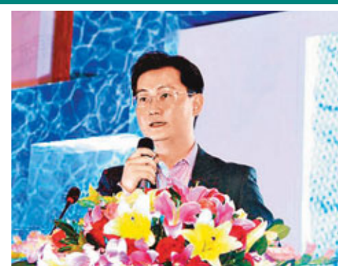
馬化騰表示，目前移動互聯網的盈利模式還未清晰。

陳德霖介紹道，今年6月起，香港人民幣支付結算系統服務時間延長至晚上9:30，以覆蓋歐美地區的需要。同時，他也表示，歡迎缺少人民幣的外國企業和銀行來香港尋求資金支持。任何一家大的人民幣業務銀行，例如中銀、匯豐等，都可以拆借人民幣。如果這些銀行無法滿足需求，還可以直接找金管局，金管局可以用和人民幣的貨幣互換協議，在有一定抵押品的情況下臨時提供人民幣。