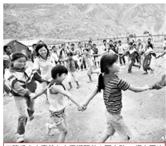
陳氏小夫妻曾在大學期間赴山區支教。

香港文匯報訊 (記者 虎靜 貴陽報道) 因諧音「要愛要愛」，很多年輕情侶選擇昨日甜蜜蜜領取了結婚證。而廣東一對新婚小夫妻，在領證當天許下新婚願：用結婚禮金，為貴州和廣西3所山區小學訂購520套冬季「甜蜜校服」，這對新人將於明年元旦攜手奔赴貴州，去他們共同支教過的山村，發放冬衣，歡度蜜月。