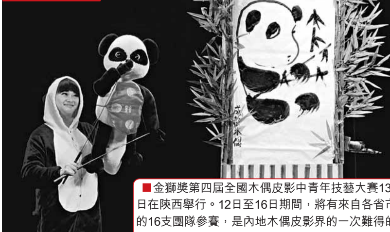
金獅獎第四屆全國木偶皮影中青年技藝大賽13日在陝西舉行。12日至16日期間，將有來自各省市的16支團隊參賽，是內地木偶皮影界的一次難得的盛會。圖為一表演者在以熊貓公仔演出。