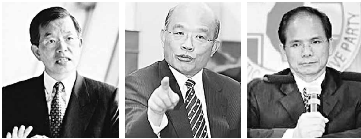
蘇貞昌(中)目前已暫緩徵詢其他委員的動作，不排除再次向謝長廷(左)、游錫堃(右)提出邀請。

黨中央的7人口袋名單包括：蔡英文、游錫堃、高雄市長陳菊、前黨秘書長吳乃仁、前「國安會」秘書長邱義仁、黨團總召柯建銘，以及蘇貞昌本人。另外9人版本的名單，則加上謝長廷及台南市長賴清德。