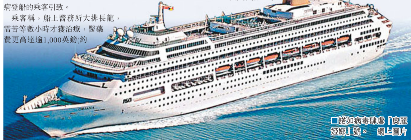
諾如病毒肆虐「奧麗姬娜」號。網上圖片