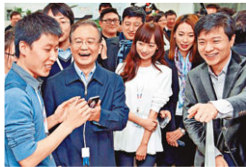
溫家寶13日在百度公司考察時,試用手機語音搜索。

溫家寶表示,中關村今後的發展,要繼續依靠深化改革和科技創新這兩大動力。要堅持改革,不斷破除舊觀念,破除造成科技與經濟脫節的體制障礙。要給企業和科技人員創造發展的條件,包括公平的市場環境、有力的政策支持、鼓勵創新的社會氛圍,尊重發明家的獨立思考和創新精神。