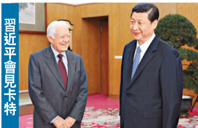
習近平會見卡特 中共中央總書記習近平13日在中南海會見美國前總統卡特時強調,新形勢下,中美雙方要不畏艱難,勇於創新,努力建設相互尊重、互利共贏的合作夥伴關係,開創中美構建新型大國關係新局面。