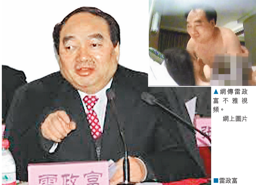
▲網傳雷政富不雅視頻。

直到2012年11月20日，雷政富和趙紅霞的一小段性愛視頻在網絡上開始流傳，重慶市紀委很快介入調查，確認視頻的真實性，雷政富應聲落馬。爆料人曾公開宣稱，自己仍