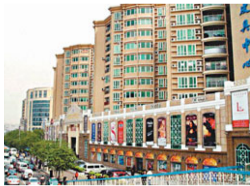
■廣州白雲世界皮具貿易中心前交通十分擁堵。 本報廣州傳真

業界人士指，穗此次大幅度減少主城區物流業佔地規模，主要為減少物流業對城區交通的不利影響。據不完全統計，廣州共有大中小型各類專業批發市場超700個。大多都在中心城區，面臨場所面積不足、商圍內擁堵等問題。