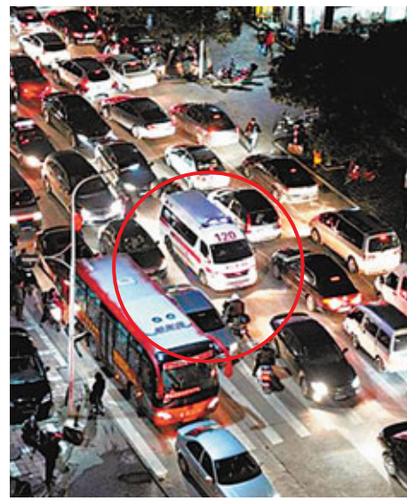
被堵在城市車流中動彈不得的急救車(紅圈)。

另外,據了解,從現在起到明年3月,北京警方將在全市範圍發起交通、治安、環境三大秩序突出問題集中管理整治專項工作,其中,包括整治闖紅燈、不走人行橫道等交通違法行為。期間,治安、交通、城管等部門將聯合組建執法小組。