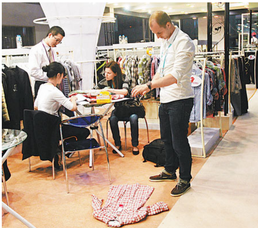
歐美需求持續疲弱,內地11月出口大幅放緩至2.9%。圖為今年廣交會外企下訂單。

此外,在出口商品中,1-11月全國機電產品出口10,645.4億美元,增長8.2%,高出同期外貿出口總體增速0.9個百分點。