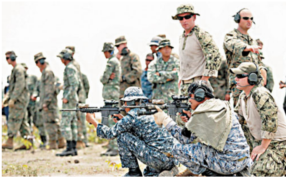
菲律賓外長日前接受訪問時表示歡迎日本重整軍備,同時,馬尼拉政府更向美國伸出橄欖枝。圖為菲美7月舉行的軍事演習。

示,現在已不是冷戰時代,不存在一國制衡另一國的問題。而中國在南海問題上的立場是明確的、一貫的,有關爭議應由當事國通過雙邊友好協商和談判加以解決,這是《南