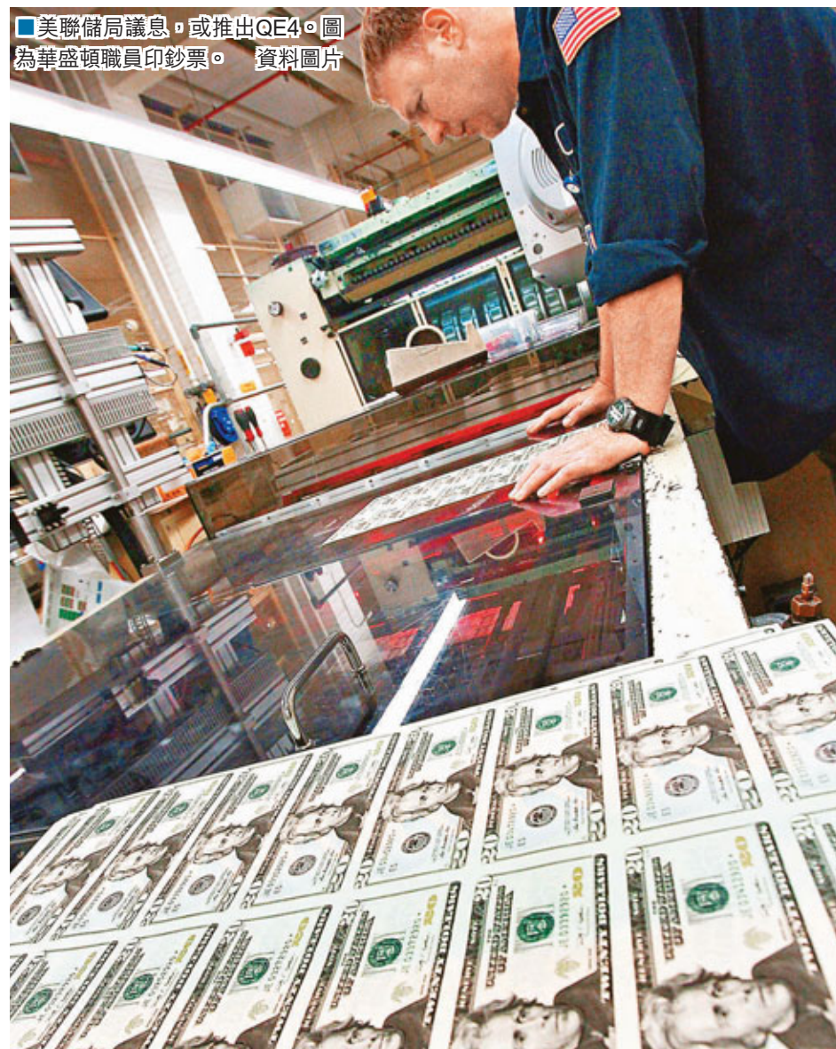
■美聯儲局職員，或推出QE4。圖為華盛頓職員印鈔票。

美國聯儲局今明兩日舉行今年最後一次議息會議。彭博調查顯示，與聯儲局直接交易的17家一級交易商表示，會上料通過每月額外購買450億美元(約3,488億港元)債券，取代年底到期的「扭曲操作」，令總買債規模增至850億美元(約6,588億港元)，變相推出第4輪量化寬鬆措施(QE4)。