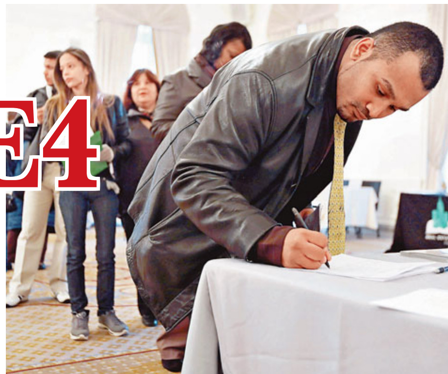
■美國失業率仍偏高，不少民眾求職。