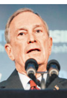
英國《金融時報》(右圖)傳出被母公司培生集團賣盤，紐約市長

彭博(左圖)據悉正洽談收購，但雙方拒絕置評。路透社母公司湯姆森路透集團也盛傳有意洽購。分析師估計，英國金融時報集團約值12億美元(約93億港元)，包括其持有的權威雜誌《經濟學人》一半股份。