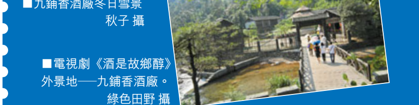
■電視劇《酒是故鄉醇》外景地——九鋪香酒廠。