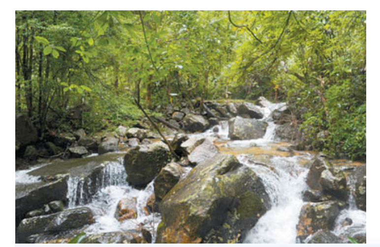
■姑婆山原始生態——清泉石上流