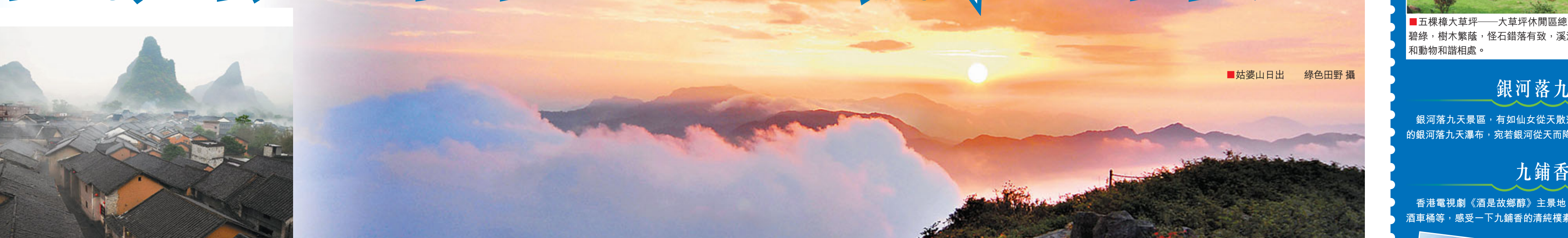
■姑婆山日出