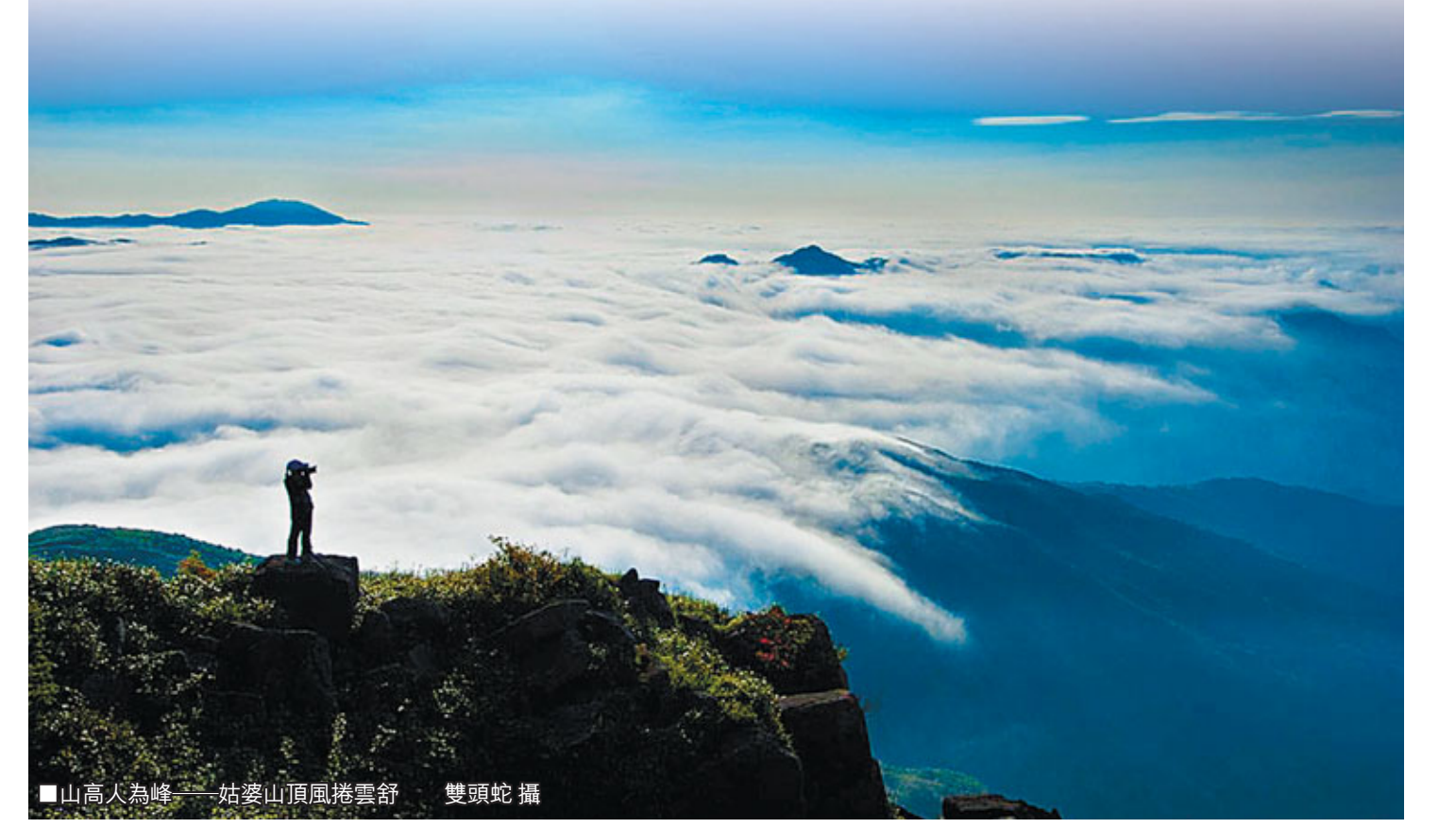
■山高人為峰 姑婆山山頂風捲雲舒 雙頭蛇 攝

姑婆山國家森林公園位於湘、桂、粵三省（區）交界處的萌渚嶺南端，廣西賀州市境內，距離賀州市區21公里，是香港—廣州—桂林黃金旅遊線上的一顆璀璨明珠。公園總面積8000公頃，園內峰高谷深、森林繁茂、瀑飛溪瀾、動植物豐富，集「雄、奇、秀、幽」於一體，被譽為「南國天然氧吧，瀑布森林公園」。