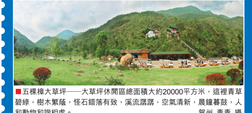
■五棵樟大草坪——大草坪休閒區總面積大約20000平方米，這裡青草碧綠，樹木繁蔭，怪石錯落有致，溪流潺潺，空氣清新，晨鐘暮鼓，人和動物和諧相處。

大草坪休閒區總面積大約20000平方米，這裡青草碧綠，樹木繁蔭，怪石錯落有致，溪流潺潺，空氣清新，晨鐘暮鼓，人和動物和諧相處，還有香港電視劇《酒是故鄉醇》外景拍攝地以及漂流中心，是一處不可多得的旅遊休閒地。