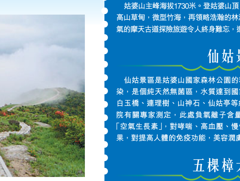
■姑婆山山頂五月十里杜鵑花海