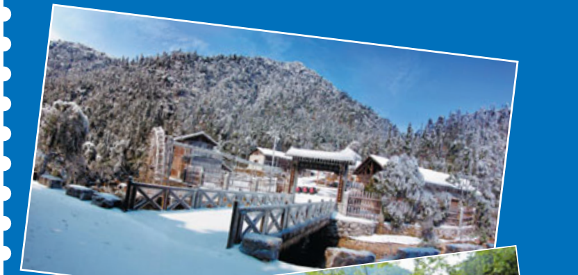
■九鋪香酒廠冬日雪景

香港電視劇《酒是故鄉醇》主景地，親身體驗劇中的水車、洗米池、酒車桶等，感受一下九鋪香的清純機素，醇酒醉人。