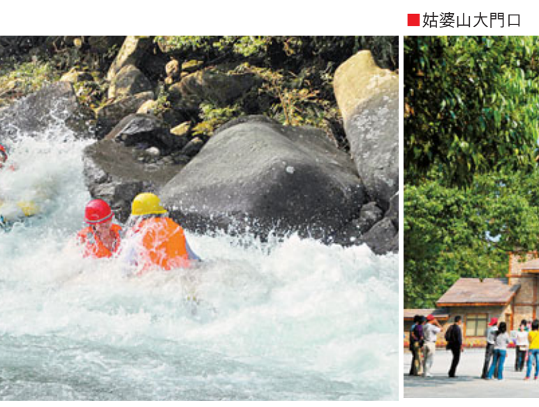
■姑婆山漂流