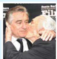
金像影帝羅拔迪尼路(Robert De Niro)前日現身聖芭芭拉國際電影節，獲大會頒贈「卻德格拉斯獎」，表揚他對影壇多年的貢獻和今年在電影《Silver Linings Playbook》中出色的表演。荷里活老牌男星米高德格拉斯、夏里遜福、金像導演昆頓塔倫天奴等人亦曾獲該殊榮。迪尼路從老牌影星卻德格拉斯(Kirk Douglas)手中領取獎項時，獲對方吻賀，並戴上眼鏡讀出致辭。當日，英國導演大衛奧羅素(David O. Russell)、男星畢利谷巴(Bradley Cooper)等人亦有現身賀迪尼路獲獎。

金像影帝羅拔迪尼路(Robert De Niro)(圖左)前日現身聖芭芭拉國際電影節，獲大會頒贈「卻德格拉斯獎」，表揚他對影壇多年的貢獻和今年在電影《Silver Linings Playbook》中出色的表演。荷里活老牌男星米高德格拉斯、夏里遜福、金像導演昆頓塔倫天奴等人亦曾獲該殊榮。迪尼路從老牌影星卻德格拉斯(Kirk Douglas)(圖右)手中領取獎項時，獲對方吻賀，並戴上眼鏡讀出致辭。當日，英國導演大衛奧羅素(David O. Russell)、男星畢利谷巴(Bradley Cooper)等人亦有現身賀迪尼路獲獎。