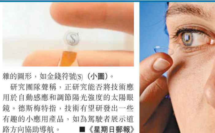
雜的圖形，如金錢符號($)(小圖)。

將來人們或可用眼睛接收短訊！比利時根特大學科學家以液晶顯示屏(LCD)製成隱形眼鏡(大圖)，透過無線網絡接收及播放來自手機的圖像或文字訊息。參與研究的德斯梅特教授表示，團隊已掌握技術，將研究實際應用途徑，料幾年後可推出市場。