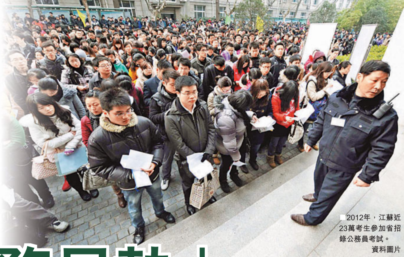
2012年，江蘇近23萬考生參加省招錄公務員考試。