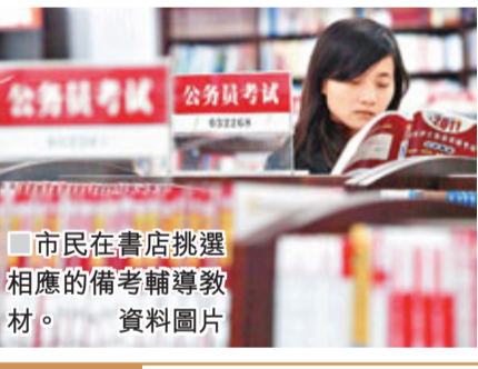
市民在書店挑選相應的備考輔導教材。

公務員工作條件舒適。首先，公務員的工作時間相對較短。內地規定一周勞動時間為5個工作日，一周工作時間為40個小時。但是國家規定的勞動時間在個體和私營企業並不能被很好的執行，更沒有強硬的監督系統。第六次人口普查對就業人口