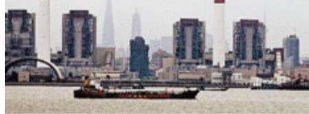
中國成為去年全球碳排放最多的國家。資料圖片

世界頂級學術期刊《自然》雜誌的《自然·氣候變化》專刊 (Nature Climate Change) 在線發表在全球氣候變化研究領域最具權威的學術機構——英國丁鐸爾氣候變化研究中心的科研報告《維持全球升溫低於2℃的挑戰》……報告指，全球二氧化碳排放將在2012年進一步增加，達到創紀錄的356億噸，而2012年預計增加的2.6%碳排放量，令全球化石燃料燃燒排放比《京都議定書》設定的基線年1990年增加58%……若計算各國的排放總量，2011年全球碳排放最多的包括中國 (28%)、美國 (16%)、歐盟 (11%) 和印度 (7%)。中國和印度兩國的排放將在2011年分別增加9.9%和7.5%，美國和歐盟則分別降低1.8%和2.8%。不過，儘管總量偏高，中國的人均排放量僅為6.6噸，與美國的人均排放17.2噸相差甚遠。