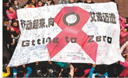
內地學生拉起「行動起來，向「零」愛滋邁進」的海報以宣揚防治愛滋病的訊息。

根據新華社報道，「世界愛滋病日」即將來臨，中國衛生部11月29日發布數據顯示，內地已累計報告愛滋病毒感染者及病人近50萬例，50歲以上老年人感染數逐年上升，僅2012年1月至10月就報告16,131例，較去年同期增加20.2%。