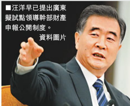
汪洋早已提出廣東擬試點領導幹部財產申報公開制度。資料圖片

在試點工作正在有序推進中……進行官員家庭財產公示，能有效防止官商勾結、權利尋租、情色交易。而進行這項工作的關鍵是權力公開要到位、制度要創新、監督要有利。