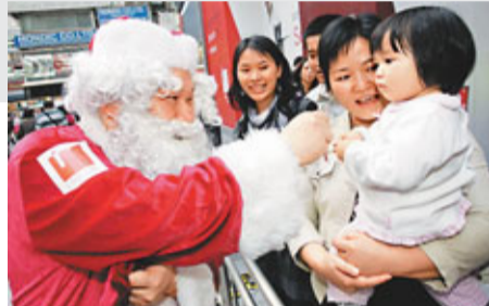
調查顯示部分家長希望透過聖誕節來促進親子關係。資料圖片

一項調查顯示，52%家長預算今年聖誕節會花1,500港元或以上買禮物給子女及宴請子女吃大餐；比率較去年增加11個百分點。至於禮物方面，30%學生最渴望收到電子產品及電腦遊戲；但家長較傾向送玩具及遊戲產品或文庫書籍……95%家長揚言有信心透過聖誕假期來促進親子關係，但44%學童不表贊同。27%受訪小學生希望聖誕假期中會花5天或以上與父母共處，但另一方面，能夠抽出5天陪伴仍就讀小學孩子的家長僅約一成。