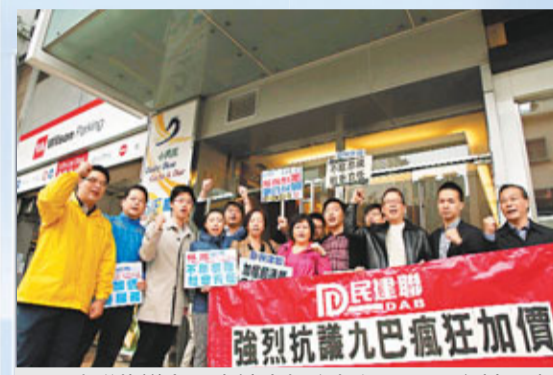
民建聯抗議九巴申請大幅度加價。資料圖片

九巴自去年5月平均加價3.6%後，11月29日向運輸署再「獅子開大口」，申請加價8.5% (較財政司長預測今年通脹3.9%，還要高出1.2倍)，平均每程車費加0.53港元，期望明年初實施。假設載客量不變，每年票價收入將增加5億港元……運輸署收到九巴的加價申請後，會按一貫做法處理，審核時會考慮一籃子因素，包括公眾接受程度及負擔能力，並在諮詢立法會及交諮會後才向行政會議提出建議，由行政會議會同行政長官審批。