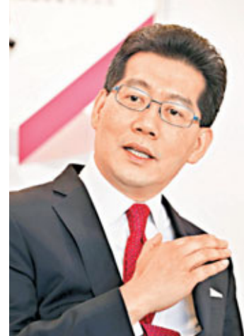
商務及經濟發展局局長蘇錦樑(見圖)上周五在亞洲知識產權商論壇後接受香港文匯報訪問時形容,特區政府將促進和推廣香港,扮演知識產權貿易和管理中心的角色,特別是借助其發展,加強香港在科研工作下游的商品化發展,「我們的科研隊伍,可以透過本地商界收購一些有初步成果的外地科研,並做出一些可迎合亞洲消費者口味的customization(量身訂做產品)」,從而將整個產業的餅做大。

就未來知識產權的發展,蘇錦樑坦言,香港雖然有強大的科研隊伍,但將這些科研成果商品化的發展卻面對許多困難。事實上,科研商品化不一定非要取材自本地科研機構孕育出來的成果,香港商界的強項是能夠知道市場的走勢和趨勢,因此,透過商界引入一些在外地已有初步成果的科研,再由香港的科研隊伍可以做一些customization(按照客戶需要製造的產品),迎合內地或亞洲的市場消費者的口味。「在customization的過程中,將需要大量設計的人才,以及科研人才,可將這個餅做大很多倍,也可培養更多應用科研人才。」