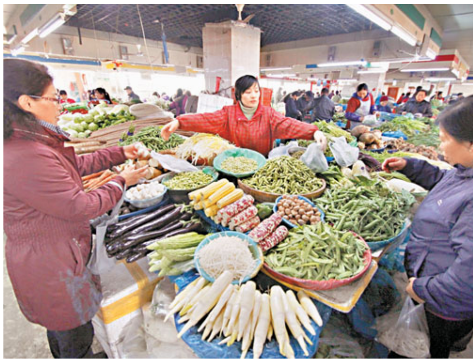
■上月鮮菜價格上漲11.3%,成為CPI上漲的主要推手。圖為消費者在江蘇省南京市一家農貿市場選購蔬菜。

美國格理集團首席經濟學家、亞太城市房地產研究院院長謝逸楓分析稱,近三個月PPI出現低位企穩態勢,雖然仍在負增長,但其同比降幅的連續兩個月收窄,表明中國經濟正處在回暖復甦階段。