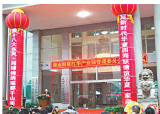
全國首個以「海聯」命名的產業園——江華海聯產業園揭牌。

引投資18.6億元人民幣(下同)、3000萬美元。湖南省委常委、省委統戰部部長、省海外聯誼會會長李微微為全國首個以「海聯」命名的產業園——江華海聯產業園揭牌。