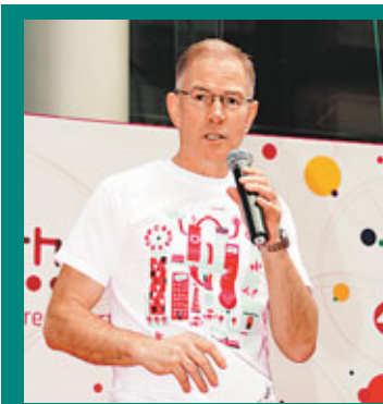
對於本港樓市,郭鵬坦言,不知道明天會發生何事,現在能做的就是等待。

香港文匯報訊(記者 涂若奔、梁悅琴)政府推出雙辣招後一個多月,本港樓價開始回軟逾2%。太古地產行政總裁郭鵬昨表示,近期的確見到本港樓市成交大幅減少,相信未來3個月仍將持續淡靜,但他認為「雙辣招」最終是否收到成效,仍有待進一步觀察。由於本地用家靜觀其變擱置入市,二手交投按月萎縮最少50%,地產界相信反映11月市況的12月二手樓登記宗數將大挫逾40%至3,500宗,創近10個月新低。