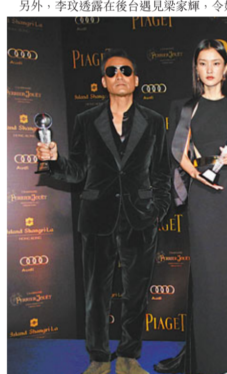
■甄子丹、李玟、杜鵑及梁家輝等昨日盛裝出席頒獎禮活動。

子丹拒談娛樂圈吸毒風波 提到近日娛樂圈藝人吸毒疑雲，以及志偉的風波，子丹拒談說：「不評論、希望事件快些過去。(陳奕迅亦就過份報道而出來說話!)唔評論，自己遇到同樣事情先算。」