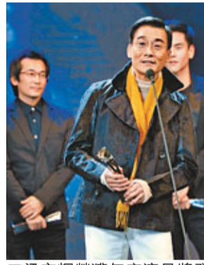
■梁家輝榮獲年度演員獎發表感言。

香港文匯報訊(記者 時燕歌 北京報導)「2012年度時尚先生盛典」日前在北京舉行，今年的「時尚先生」殊榮由男演員陳坤、導演高希希、建築師張永和、先鋒文學代表人物格非、鋼琴家李雲迪、倫敦奧運會羽毛球男雙冠軍風雲組合蔡赟和傅海峰、主持人白巖松、新浪董事長兼CEO曹國偉等人共同獲得。 除頒發時尚先生獎項外，還揭曉了榮獲其他獎項的名單，其中「年度演員獎」由三度問鼎香港電影金像獎影帝梁家輝獲得，「年度慈善人物」為李亞鵬，「港台年度最受歡迎藝人」為黃宗澤，而「海外年度最受歡迎藝人」則由車勝元奪得。梁家輝獲獎時表示：「得