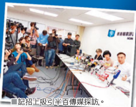
記招上吸引半百傳媒採訪。