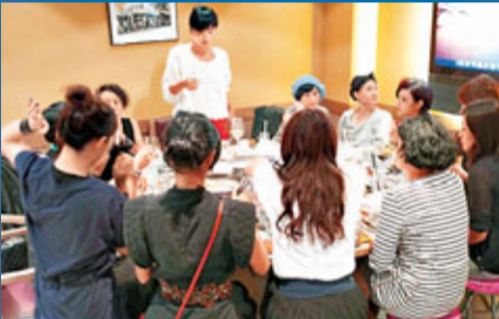
飯局上，男友人與女友人分枱而坐。