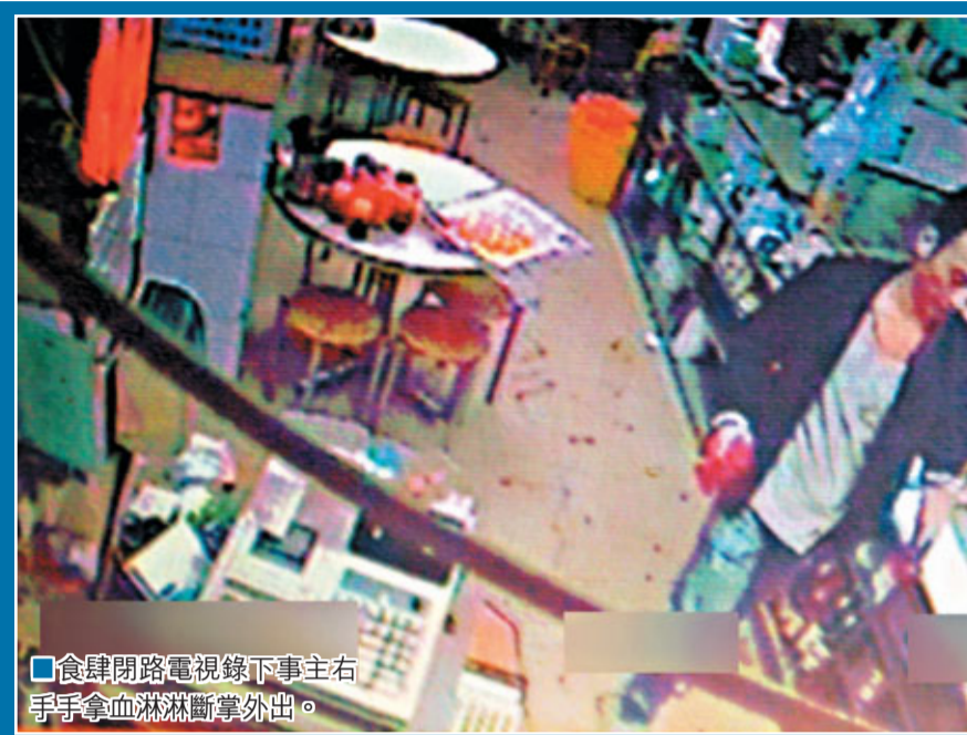
食肆閉路電視錄下事主右手手拿血淋淋斷掌外出。

香港文匯報訊（記者 杜法祖）「K仔」（氯胺酮）害人不少！一名疑有「索K」惡習青年，疑受K毒影響，不足一年2度揮刀自斷左掌。青年去年杪在將軍澳家中疑「索K」後以利刀自斷左掌，送院成功駁回後，前晚走到觀塘一間通宵營業茶餐廳，向店員稱「唔該借把刀用吓」，逕自入廚房取用斬骨刀，當眾將左掌砍斷，之後更若無其事手持斷掌步出食肆，店員食客見狀嚇至目瞪口呆。警員到場將青年連同斷掌送院，有人送院時仍高叫「唔好幫我駁，駁返都冇用！」警方將事件列作「發現精神有問題人士」處理。