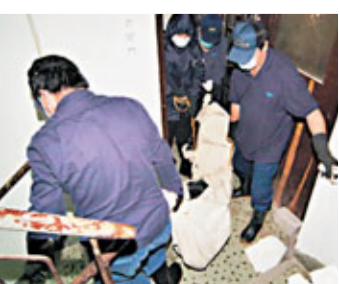
燒炭夫婦遺書死控被無理解僱，作工將屍體移離現場。

昨午4時許，同屋房客嗅濃烈異味，懷疑是該對多日沒有露面夫婦的房間傳出，覺有可疑報警。消防員到場破門入內，揭發該對夫婦雙雙倒斃床上，屍體已發脹發臭，房內有炭燭，相信2人燒炭死去多日，稍後，警方聯絡上男死者的弟弟助查，透露已有1星期聯絡不上其兄嫂。