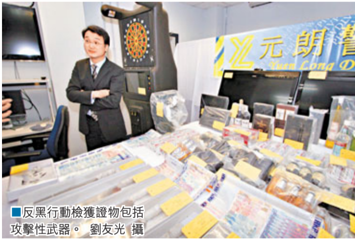
反黑行動檢獲證物包括攻擊性武器。

香港文匯報訊（記者 杜法祖）針對2個活躍元朗與天水圍的黑幫及打擊其收入來源，元朗警區展開代號「松徑」反黑行動，派出臥底神探滲入有關黑幫蒐證3個月，掌握足夠證據後「收網」，過去3日出動逾百警力搜查區內多處地點，共拘捕93人，逾半有黑社會背景，並首次破工廈無牌樓上酒吧，專門做青少年熟客生意，賣酒及舉行毒品派對，其中7名被捕者即為工廈無牌樓上吧的未成年顧客。行動中警方並檢獲少量毒品、賭款及攻擊性武器。警方行動仍在進行，不排除會有多人被捕。