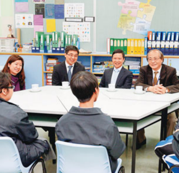
吳克儉與有特殊學習需要的學生傾談,聆聽他們分享學習生活。