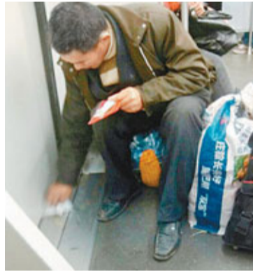
民工先擦掉了地上的嘔吐物。

據網友微博透露，前晚7點10分左右，上海地鐵2號線列車將進陸家嘴站時，一位獨自乘車的四十歲左右的民工師傅暈車嘔吐。該網友遂給了這位師傅一包紙巾，讓他擦嘴。接下來的一幕讓人感動而且心酸：師傅沒有擦嘴，而是先擦掉了地上的嘔吐物。「這就是素質。」該網友在微博裡感慨道。截至發稿，這條微博已經被轉發近2800次。