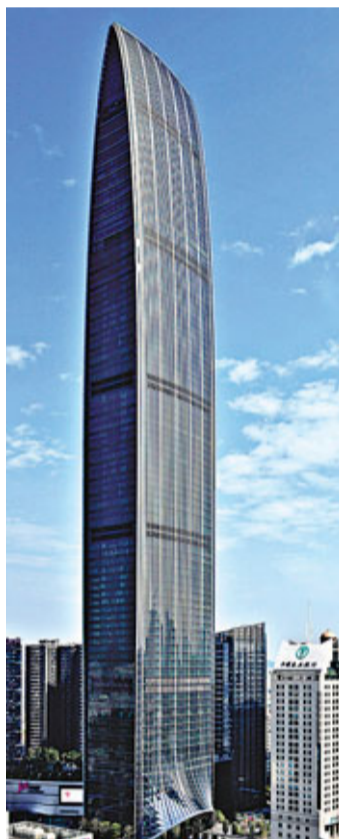
深圳第一高樓京基100

被譽為「建築界奧斯卡」的安波里斯摩大獎，本年度得獎的10大最佳摩天大廈名單日前出爐。美國紐約斯普魯斯8號力壓220個候選建築居首，設計師是有「建築界畢加索」美譽的美國建築大師蓋瑞(圖)，其最新作品包括香港東半山豪宅傲璇(OPUS HONG KONG)；而中國深圳及天津亦各有一座高樓入選。