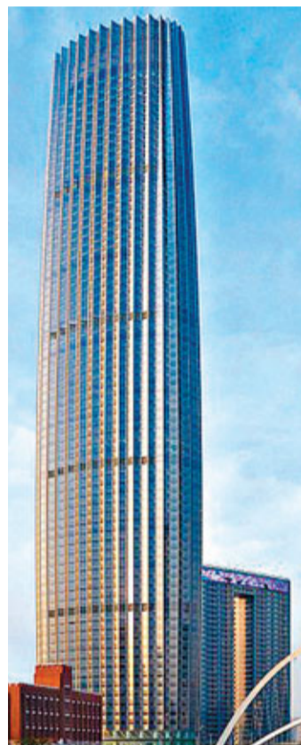
天津環球金融中心

斯普魯斯8號樓高265米，是全球第12高的住宅大廈，建築物外牆鋪上逾萬塊不鏽鋼板，形狀不一，盡顯線條美。評審認為，斯普魯斯8號形象突出，為曼哈頓天際線錦上添花。