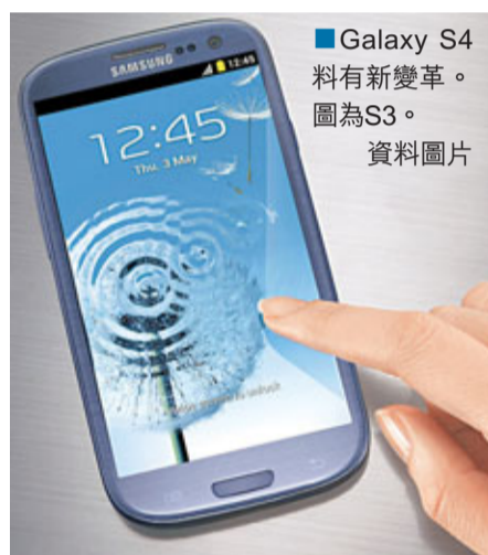
Galaxy S4 料有新變革。圖為S3。資料圖片

韓國三星有傳將加快旗艦智能手機Galaxy S系列的推出步伐，新一代SIV或最快於明年4月面世，可能配備無懼撞擊的「不碎」膠質軟性顯示屏。分析預料，新機屏幕將更寬更清晰，影像密度將增至每吋441像素(ppi)，高於iPhone 5的326 ppi。