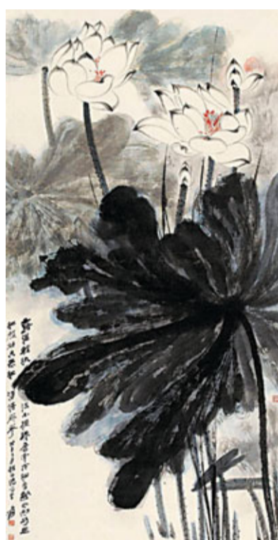
張大千《白荷》 估價650—950萬港幣，成交價747.5萬港元。