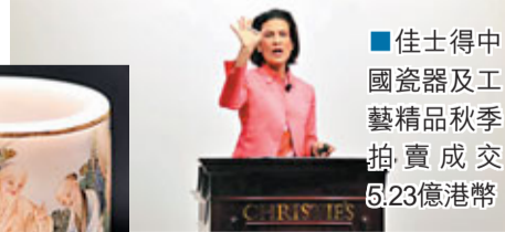
佳士得中國瓷器及工藝精品秋季拍賣成交5.23億港元