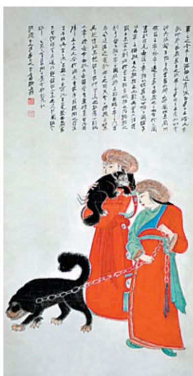
張大千作《番女掣龐圖》

如今，中國內地兩大拍賣行中國嘉德、保利秋拍前相繼宣佈高調進入香港藝術品拍賣市場，無疑對秋拍來說是一重磅炸彈。拍賣市場的版圖變化，自然吸引着藏界眾人眼球，無論是拍賣結果還是拍品徵集水準，保利拍賣（香港）今秋的首拍，都是瑟瑟涼風中的一項盛展。 文：張夢薇，圖：香港保利提供