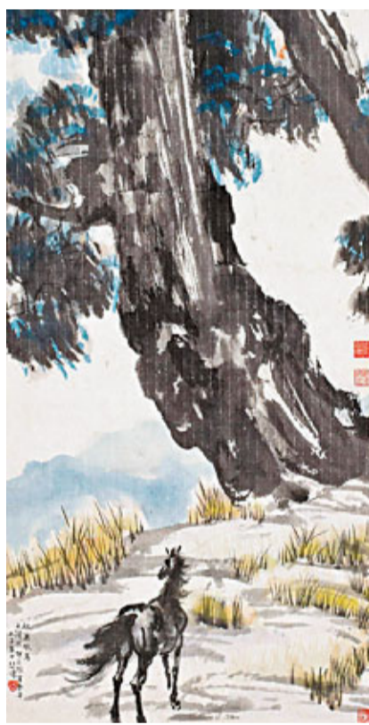
徐悲鴻作《秋高牧馬》

如今拍賣市場繁榮發展，今年行情有小小上揚趨勢，但由於眾多拍品流通週期較短，所以從未在市場上出現的名家精品也越來越少，價格越來越高，與此同時，拍賣行的徵集難度也越來越大，剛剛收鐘的保利（香港）此次秋拍拍品，種類至繁，上自晚清，下逮當代，所有近世流派傑作，靡不畢具。其中以滬上收藏巨擘所珍藏的張大千重彩仕女、細筆山水最為藏界稱道。