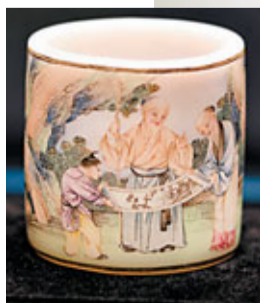
清乾隆胎畫珐瑯四老圖小筆筒

亞洲市場的疑慮，再次印證香港作為主要拍賣中心的地位。本年秋季拍期間，香港佳士得還舉辦了「古韻天成：臨宇山人宋瓷珍藏展覽」，展示80件來自日本私人收藏的200多件北宋定窯、磁州窯及南宋哥窯、龍泉窯精品；以及「閱墨：中國當代水墨畫展」，展示楊詰蒼、劉國松等名家畫作。