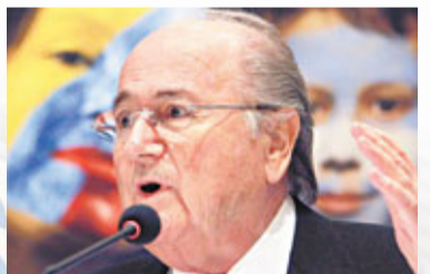
荷蘭足壇近日發生慘劇，一名助理裁判在一場青年比賽中被球員毆打致死。國際足聯主席白禮達(見圖)在聽聞這一消息後表示十分震驚，4