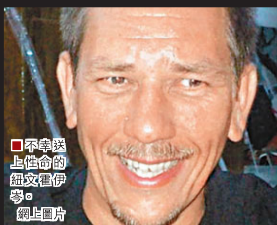
不幸送上性命的紐文霍伊。網上圖片