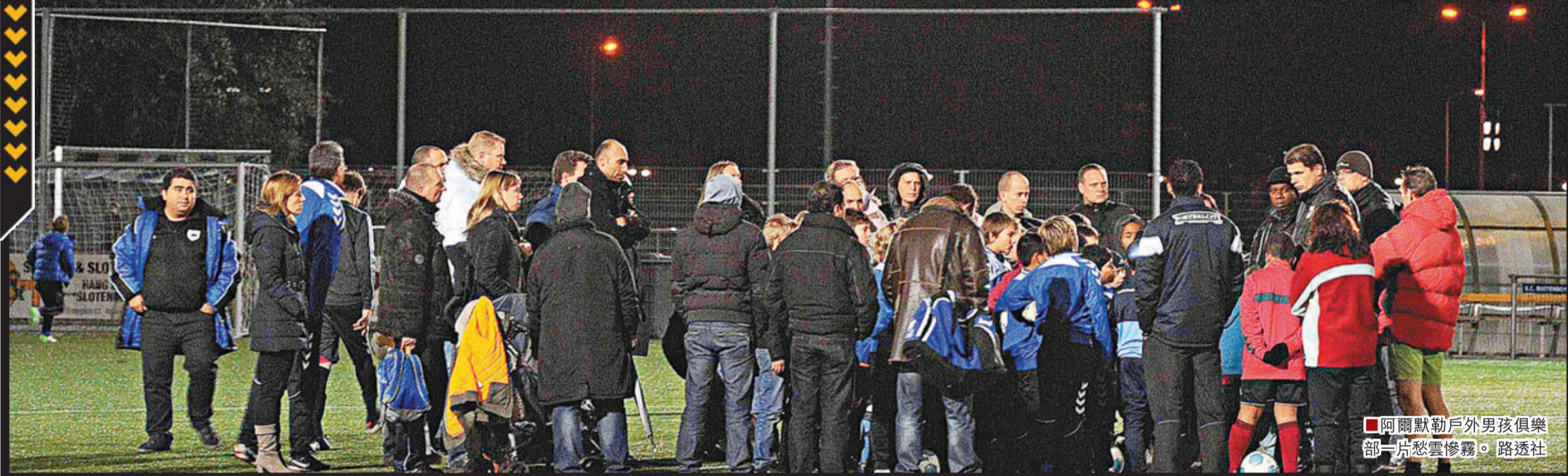
阿爾默勒戶外男孩俱樂部一片愁雲慘霧。