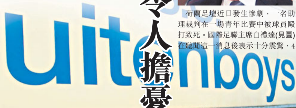
球會下半旗哀悼。