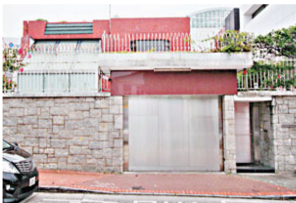
■上演《桃姐》現實版感人故事的約道9號大宅。