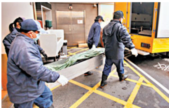
■在僱主大宅昏迷猝逝的現實版「桃姐」屍體,由件工昇送殮房。