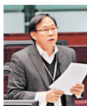
張建宗強調政府並非「零支援」。

勞工及福利局局長張建宗在回應時表示,當局無意統一長者福利措施的年齡規定,但會一直檢討、靈活處理。他承認政府沒有專門協助60歲至64歲人士就業的措施,但強調政府對他們並非「零支援」,指勞工處所有就業中心均設有特別櫃位,為年滿50歲或以上的求職人士提供優先登記及就業轉介服務,並推行「中年就業計劃」鼓勵僱主聘用年滿40歲或以上的求職人士,此計劃去年轉介了337名60歲或以上長者成功就業,