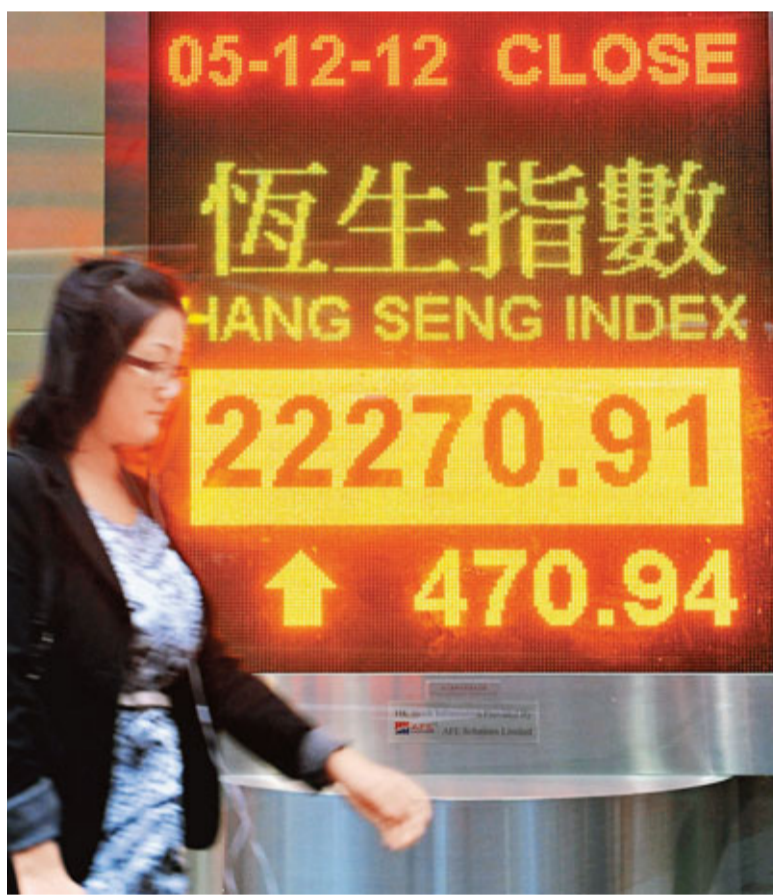
受惠熱錢湧入及內地股市反彈，港股昨升470點，收報22,270點。

藍籌股全線向上，匯控落實以逾727億元悉售平保股份予卜蜂集團，有關交易後可獲利200億元，該股升1.7%，返回80元見一年新高，平保亦急升5%，並成升幅最大藍籌。A股造好下，內銀及內險股跟漲，建行(0939)及交行(3328)均升約