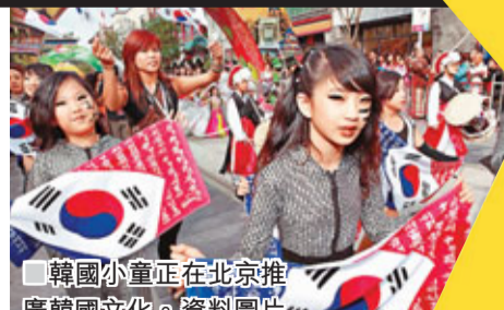
■韓國小童正在北京推廣韓國文化。