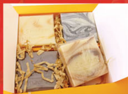
四季桐花禮盒 各款護膚功能的「四季天然手工坊」的手工藝