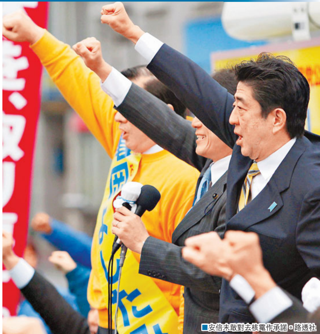
安倍未敢對去核電作承諾。