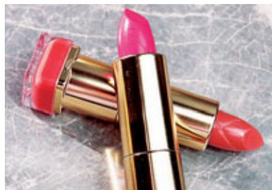
經檢驗的22種唇膏品牌，逾半含鉛。網上圖片

目前美國食品及藥物管理局(FDA)無訂定唇膏含鉛標準，由廠商決定如何作安全檢驗。製造商並非蓄意把鉛放入唇膏，不過很多着色添加劑由無機物製成，不過很多着色添加劑由無機物製成，含有可在土壤、水與空氣中發現的少量鉛。