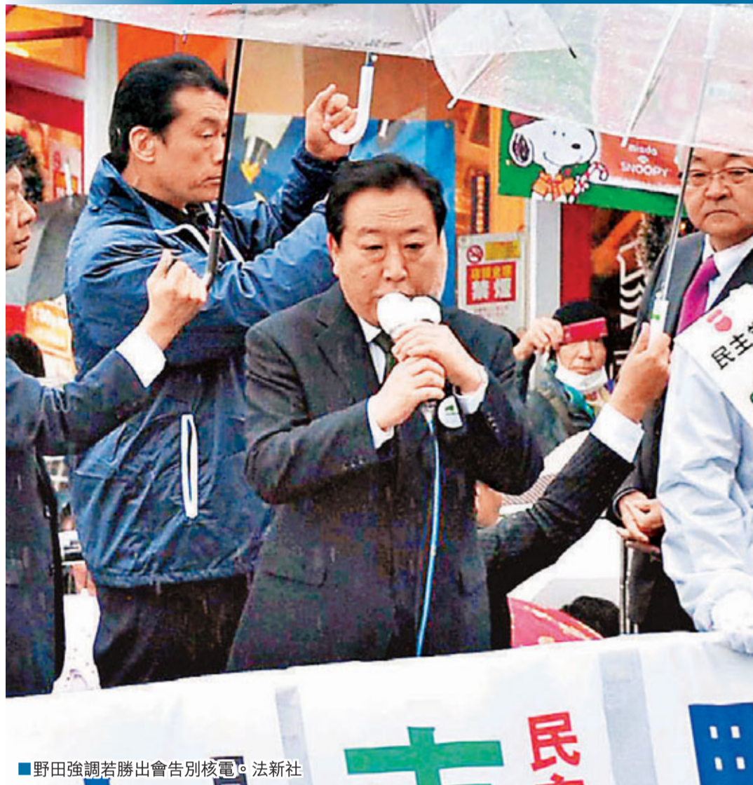
野田強調若勝出會告別核電。