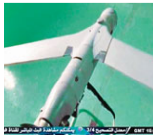
伊朗領空後立即被捕捉。

伊朗前日稱，革命衛隊在波斯灣的伊朗領空內捕獲一架美軍無人機，但未提及捕獲方法及時間等細節。伊朗當局發放一段影片(見圖)，聲稱影片顯示一架塗有「掃描鷹」無人機，正由穿著制服的軍人檢查，上面有標語寫着「我們將會踐踏美國」。美國海軍司令部則否認有無人機在中東失蹤。