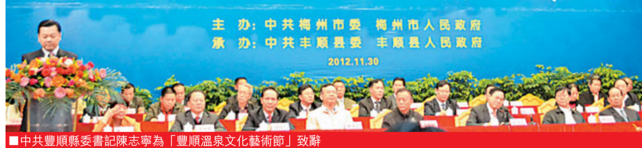
中共豐順縣委書記陳志寧為「豐順溫泉文化藝術節」致辭