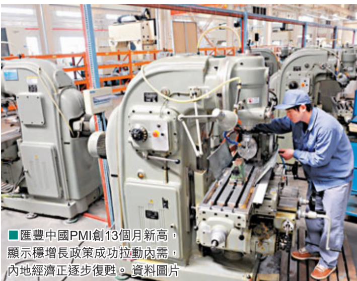
匯豐中國PMI創13個月新高, 顯示穩增長政策成功拉動內需, 內地經濟正逐步復甦。資料圖片

但高盛高華認為, 內地製造業在11月繼續穩健增長, PMI上升將令內地政府進一步放鬆政策的可能性降低。不過, 該行仍預計未來一年內地經濟將逐步增長, 惟不能忽視增長在溫和上行趨勢中, 或會出現暫時回調的可能性。