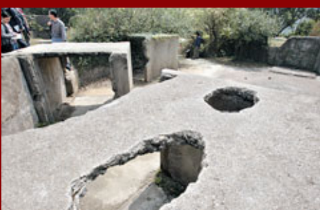
■炮台處處都是戰爭留下的痕跡