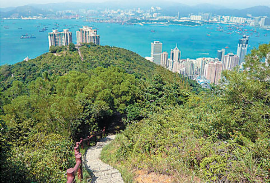
■由歷史徑回望維港風景

早在1898年，英國軍備委員會已建議在港島西北的一座海拔1,009英尺山上，即後來松林炮台所在地，興建一座炮台，以增強海港西部的防衛能力。炮台其後於1901年動工，4年後完成。炮台位處海拔307米的高地上，以地勢來說，實為全港炮台之冠。