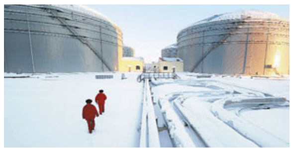
溫家寶訪俄,將談能源合作。圖為漠河輸油站原油管道。

中國社科院俄羅斯東歐中亞研究所所長吳恩遠認為,朝鮮宣佈將於本月10日至22日間發射衛星一事,料將成為中俄會晤重要議題之一。經貿合作方面,中國國際問題研究所所長曲星表示,中俄仍有提升空間,能源資源開發是合作重點,相信雙方將根據比較優勢增加相互投資。